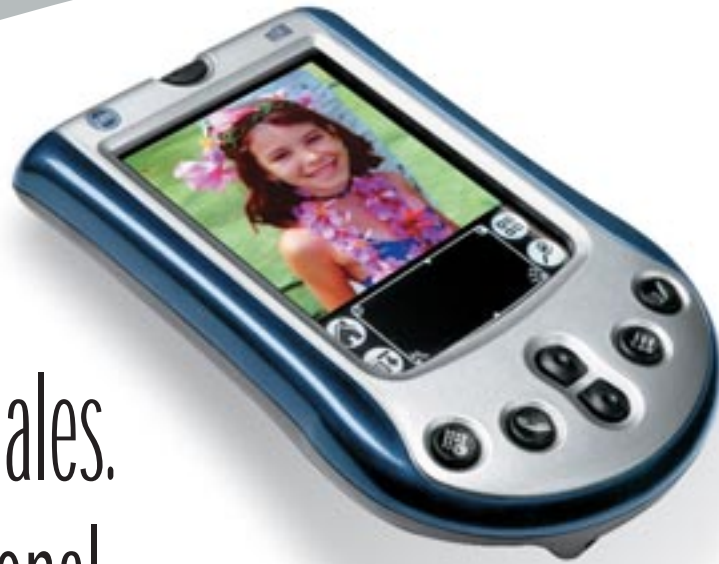
Computadora de mano Palm™ m130